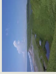
眺望太平洋的丘陵

三條路線中唯一能看到大海的步行行程。美麗的海岸線絕對能讓你迷醉。另外，雖屬平原地帶，但春夏季節也可觀賞到只生長於高原的高山植物與花卉。